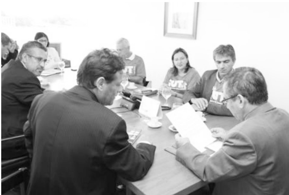
CUT, Governo e empresários discutem pacto trabalhista nas obras do PAC

Portanto, todas essas centrais permanecem no campo do governismo e do peleguismo. Não é por acaso que o Ministério do Trabalho e Emprego está nas mãos do PDT e um grande número de ex-sindicalistas preenchem importante cargos no go-