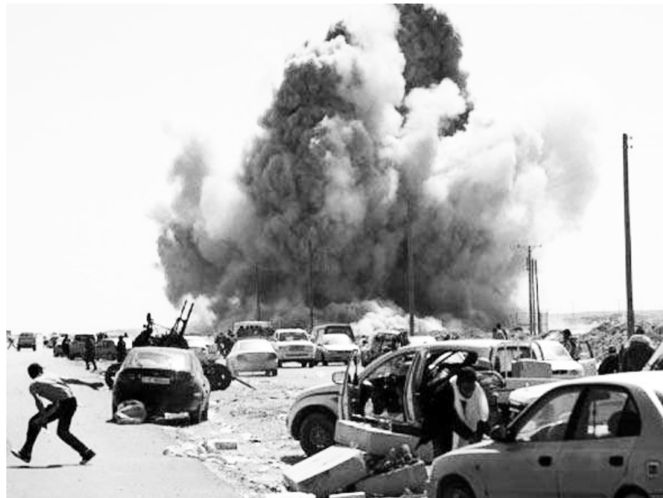
Líbia sob ataque da OTAN

Em fevereiro de 2011 eclodiu uma guerra civil que opõe os setores da burguesia e da burocracia líbia aliados de Kadaffi aos os setores da oposição burguesa pró-restauração monárquica e imperialista. Os oposicionistas formaram o Conselho Nacional de Transição da Líbia, rapidamente reconhecido como o governo